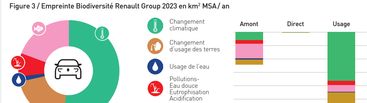
Figure 3 / Empreinte Biodiversité Renault Group 2023 en km 2 MSA / an

L'analyse des impacts de Renault Group sur la biodiversité a été basée sur la méthodologie d'empreinte biodiversité Corporate Biodiversity Footprint (CBF), qui utilise la métrique de l'abondance moyenne des espèces combiné avec des unités de surface et de temps (Means Species Abundance ; km 2 MSA.an) pour évaluer l'intégrité écologique des écosystèmes par rapport à leur état vierge. Les résultats permettent de comparer les impacts en fonction des différents facteurs de perte (changement d'usage des terres, exploitation des ressources naturelles, changement climatique, pollution) et des différents écosystèmes (eau douce, terrestre), ce qui aide à hiérarchiser les enjeux.